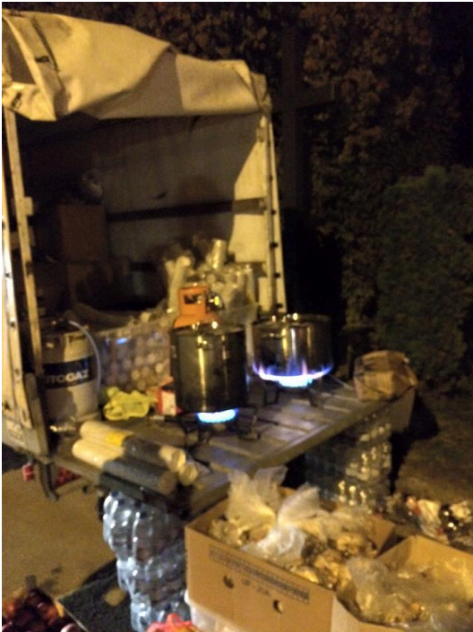
23. Oktober und 24. Oktober Vorbereitungen für den Zug um 00:30 Treffen...